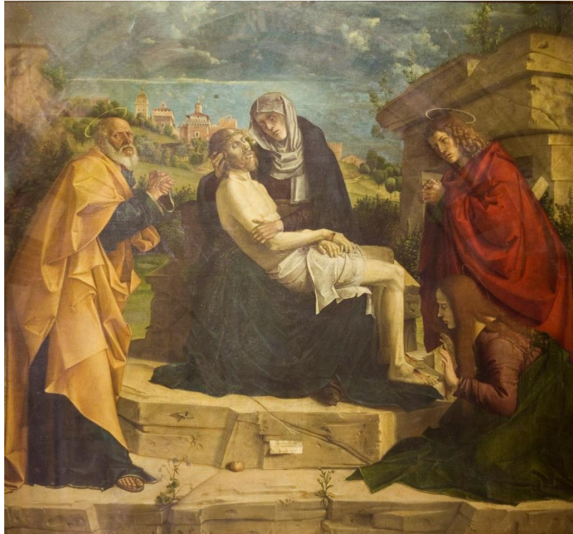
Fig. 1 Bartolomeo Cincani detto il “Montagna”, Compianto su Cristo morto (“Pietà”), 1500 (o 1505?), olio su tela, Vicenza, Basilica di Santa Maria di Monte Berico (altare della Pietà all’interno della chiesa gotica)