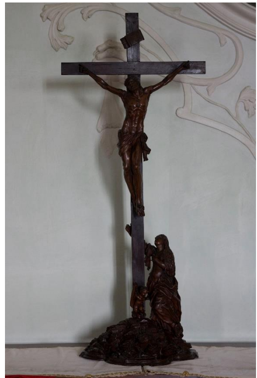
Fig. 3 Bottega di Andrea Brustolon, Maria Maddalena ai piedi della croce , scultura lignea, primi decenni del XVIII sec., Vicenza, Museo di Monte Berico (“Tesoro della Madonna da Monte”)