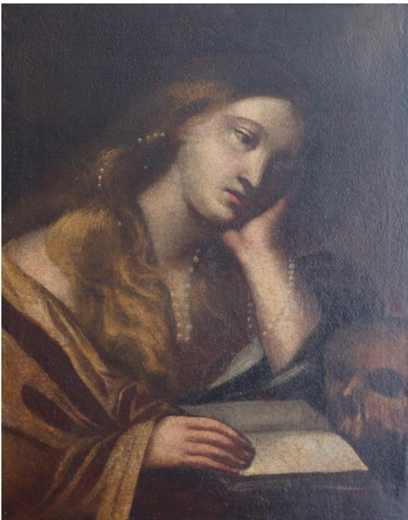
Fig. 1 La Maddalena penitente in contemplazione , XVII sec., olio su tela, Vicenza, Museo di Monte Berico (“Tesoro della Madonna da Monte”)